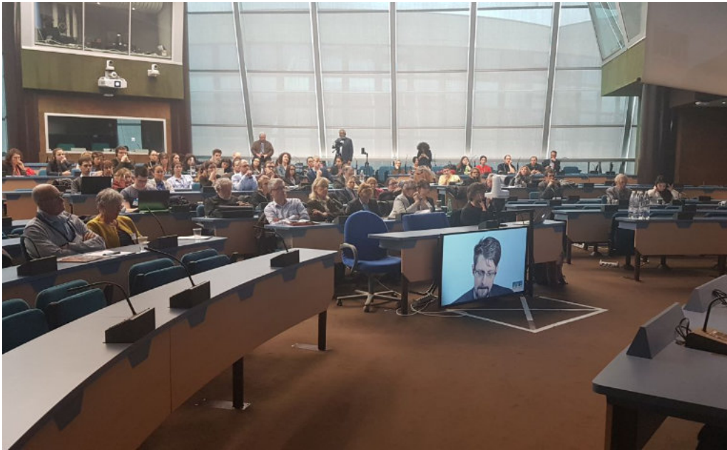
Edward Snowden en duplex dans l'amphithéâtre de la salle 6 du Conseil de l'Europe

« la démocratie est un combat commun. Nous en faisons tous partie et si nous ne jouons pas tous un rôle, que l'on soit le lanceur d'alerte ou le législateur alors notre système échouera... Je ne suis pas un ennemi des États-Unis. J'aime mon pays, y compris la NSA, le FBI et toutes ces agences de renseignements qui m'ont fait tant de mal. Je ne veux pas leur nuire. Je veux les réformer... Les secrets sont toxiques... dénoncer n'est pas un acte hostile. Ce n'est pas l'acte d'un ennemi. C'est l'acte d'un ami.* » E. Snowden