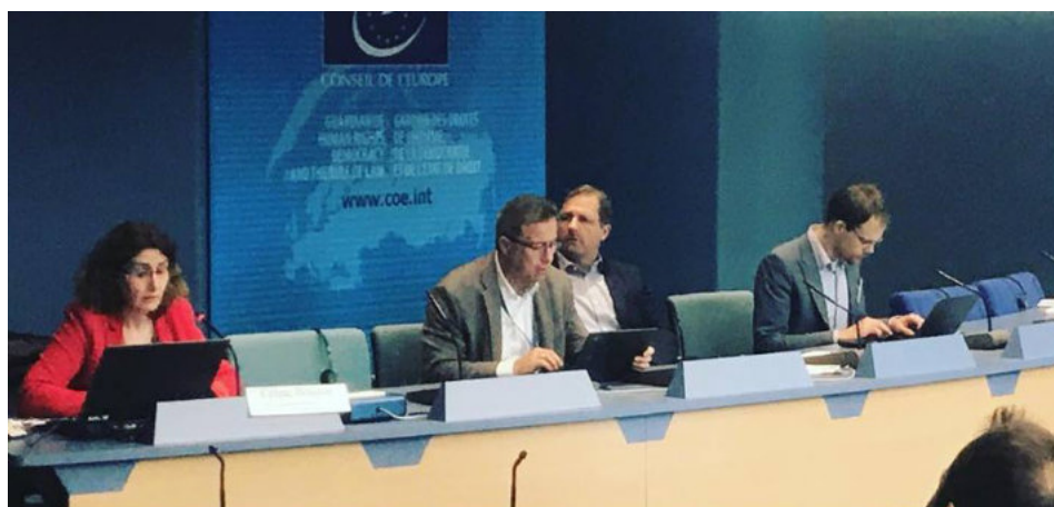
Sylvain Waserman et Günter Schirmer ont ouvert les débats dans la salle 6 du Conseil de l'Europe

Point d'orgue de ces « 48H Chrono », la rencontre entre le public présent dans l'auditorium de la salle 1 et l'écran de 4x4m sur lequel le visage de l'un des plus célèbres lanceurs d'alerte de la planète s'est affiché, Edward Snowden.