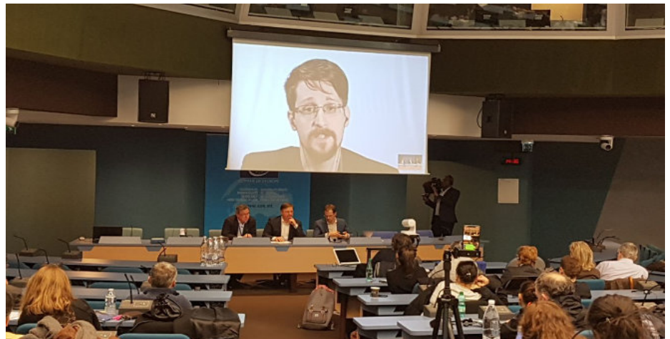
Edward Snowden en duplex dans l'amphithéâtre de la salle 6 du Conseil de l'Europe

Son histoire, son expérience et ses propositions ont été particulièrement suivies par le public présent qui a pu échanger directement avec lui et cela pendant près de 50 minutes. Pour lui, la notion de « patriotisme » n'est pas incompatible avec l'action du lanceur d'alerte, bien au contraire.