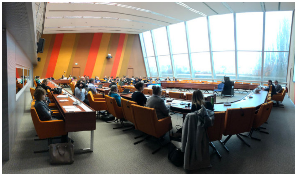
Lors des débats dans la salle 1 du Conseil de l'Europe

Missionné par la commission des affaires juridiques de l'APCE, il lui a été demandé de produire un rapport avec force propositions. Comme à son habitude, le député a convié tous les acteurs du sujet, experts, universitaires, citoyens, associations, élus à venir réfléchir et co-construire ce rapport.